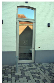
Nebeneingang vom Parkplatz