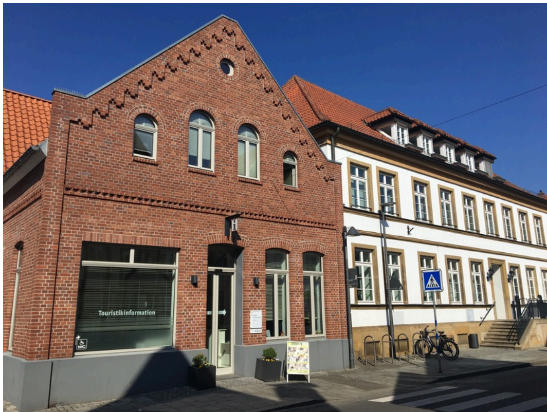
Tourist-Information Rietberg